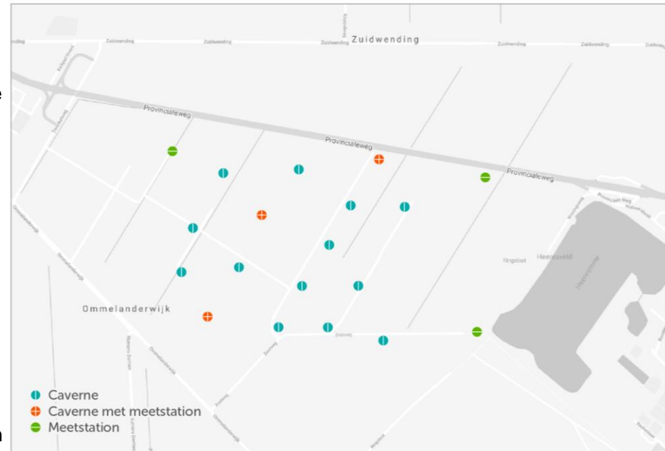
Microseismisch netwerk Zuidwending (Gemeente Veendam)